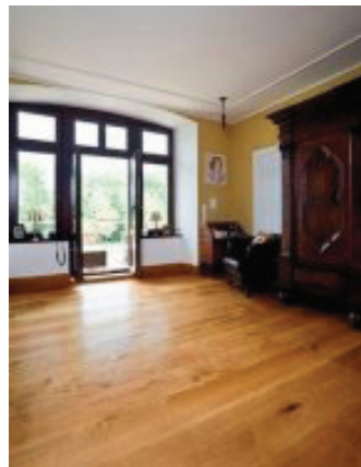
Hagensieker Schlossdielen Eiche Natur-Sortierung