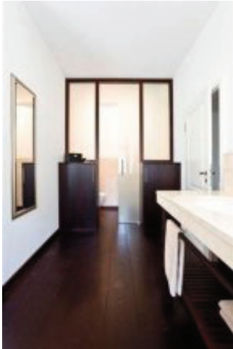
Hagensieker proGOODWOOD Thermoeiche Schlossdielen 1. Sortierung und Schnittholz für Möbel und Türen