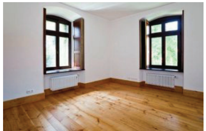
Hagensieker Kirschholzdielen aus dem eigenen Garten